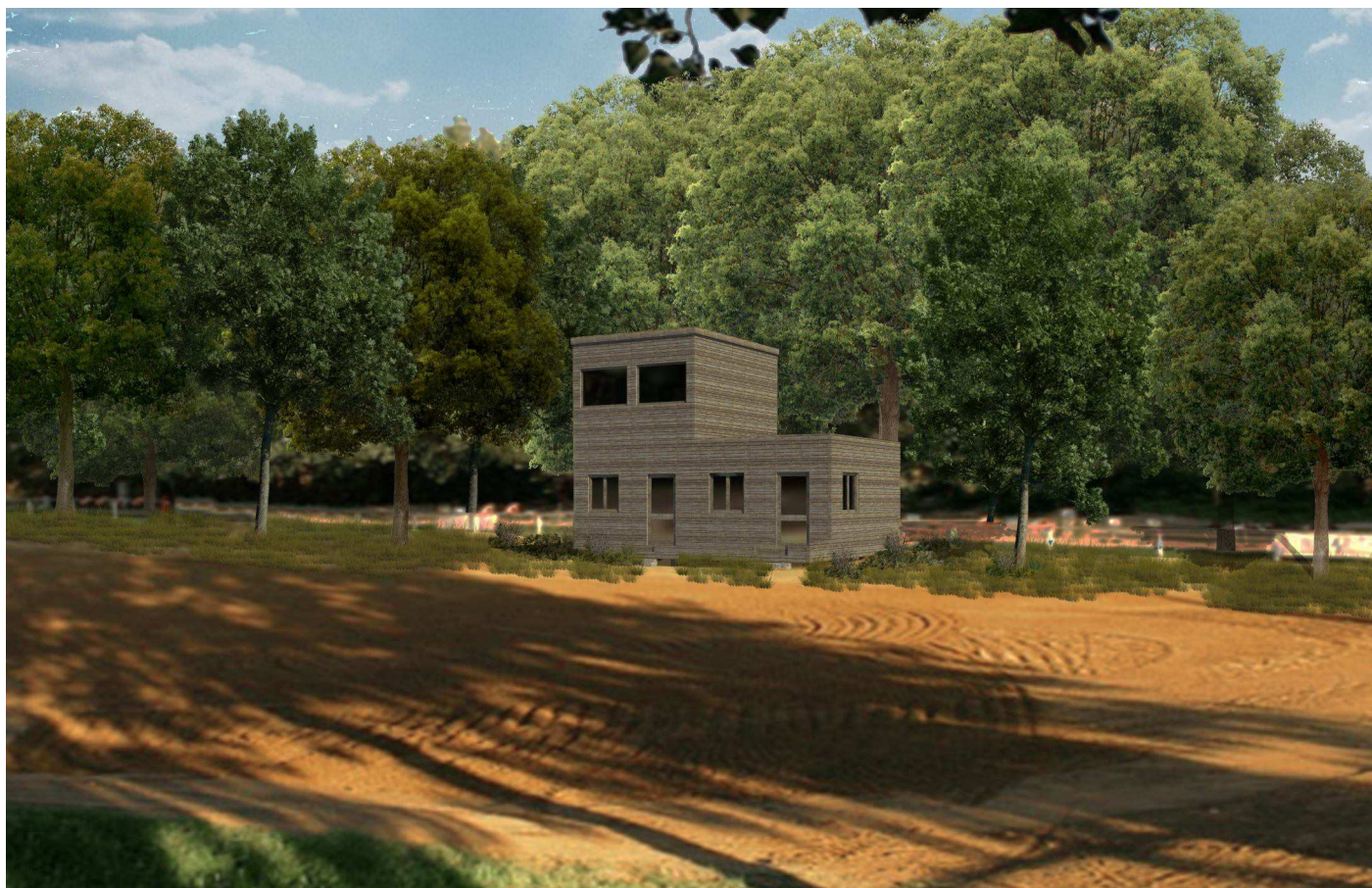
GIUDICI - CRONOMETRISTI - ZONA PARTENZA