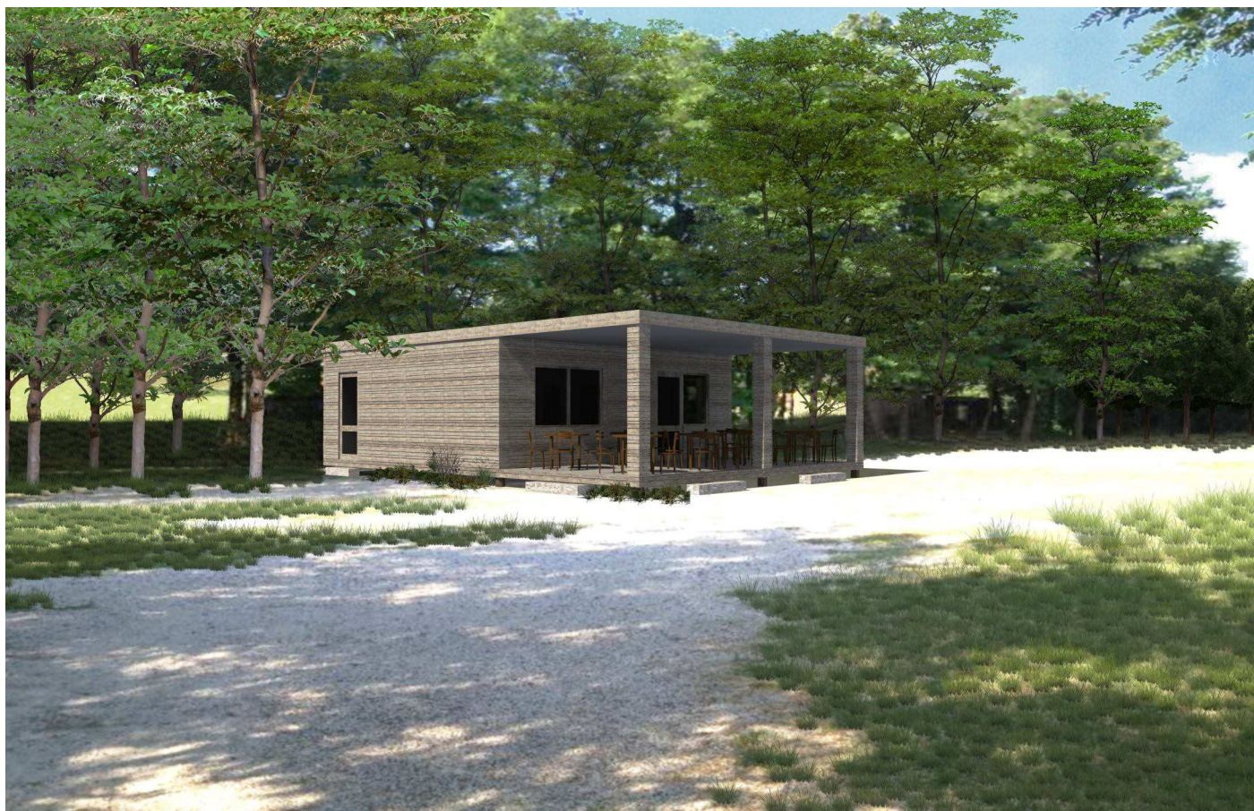
BAR - UFFICIO GESTORE